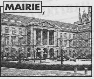
place du Général de Gaulle Tél. 02 35 08 69 00