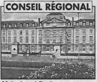
25, boulevard Gambetta Tél. 02 35 52 56 00