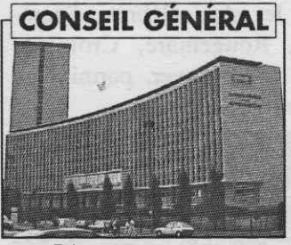
cours Clémenceau Tél. 02 35 03 55 55