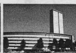
Extension conseil général