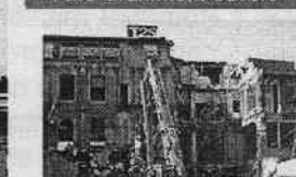
Rénovation de la rue Lafayette