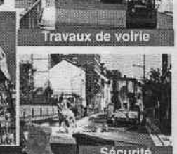
Sécurité routière route de Darnétal