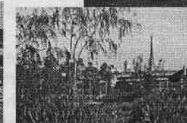
Parc Grammont ouvert