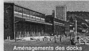
Aménagements des docks