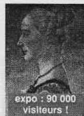
expo : 90 000 visiteurs !

Multiples chantiers, événements culturels, infrastructures majeures : voici quelques clichés pris le 6 septembre 2006