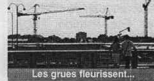
Les grues fleurissent...