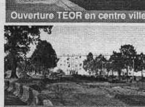
Travaux du cours Gallée