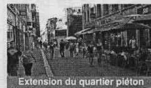
Extension du quartier piéton