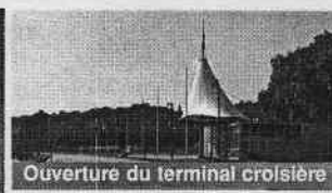
Ouverture du terminal croisière