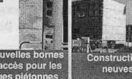
Nouvelles bornes d'accès pour les rues piétonnes