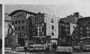
Ouverture de la halte routière