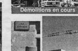
Démolitions en cours