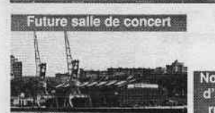
Future salle de concert