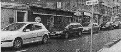
TEOR : voitures prises au piège de la signalisation.

Vous avez aussi la possibilité de recevoir gratuitement La Gazette par Internet en le demandant à « lagazette@aol.com » !