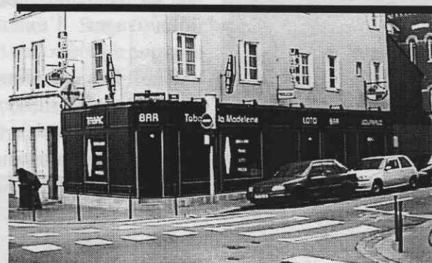
(angle de la rue du Pré de la Bataille, derrière la Préfecture, Brasserie)

le mardi 10 novembre 1998 à 19h30 au bar-tabac de la Madeleine - 21, rue de Constantine