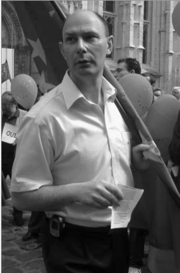
Marche pour l'Europe. Mai 2005