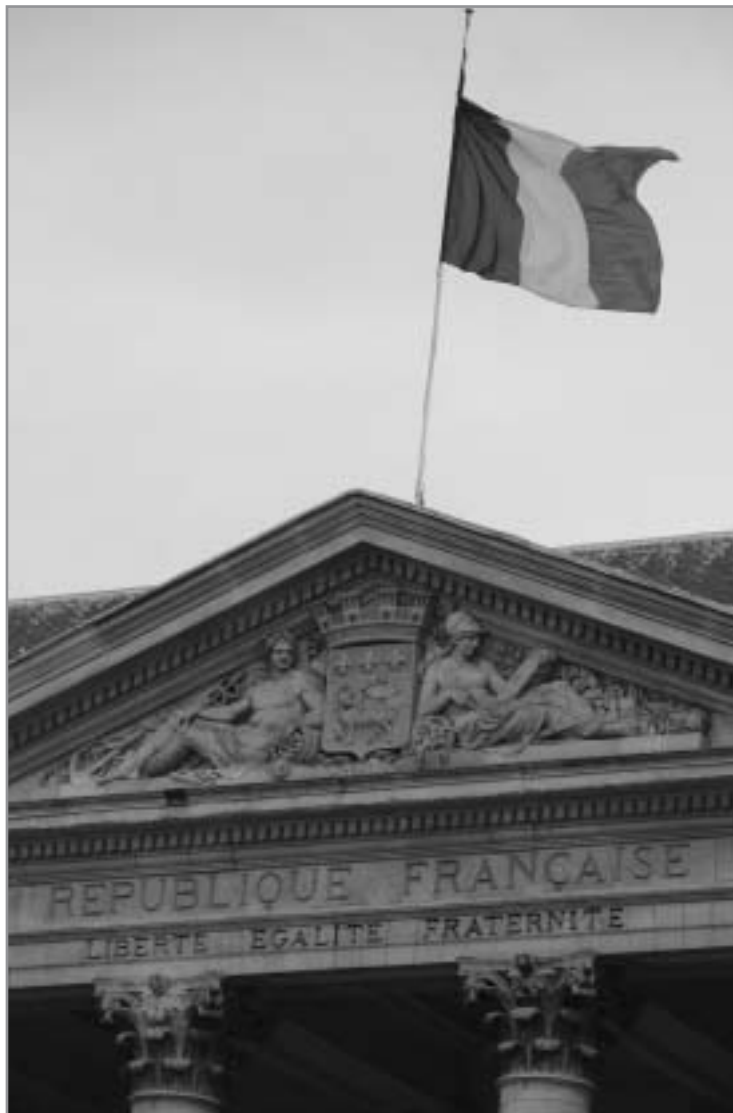
Fronton de la mairie de Rouen. Février 2006