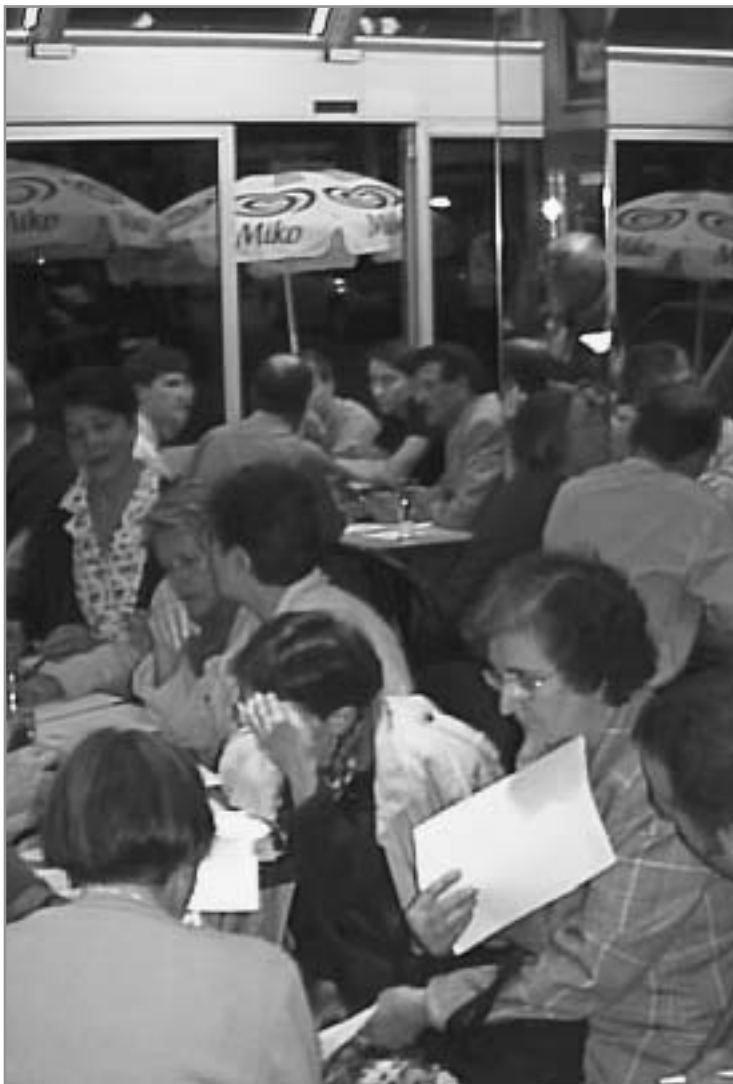
Seconde Assemblée Communale des Citoyens de Rouen (Café des Chrysanthèmes) Septembre 1998