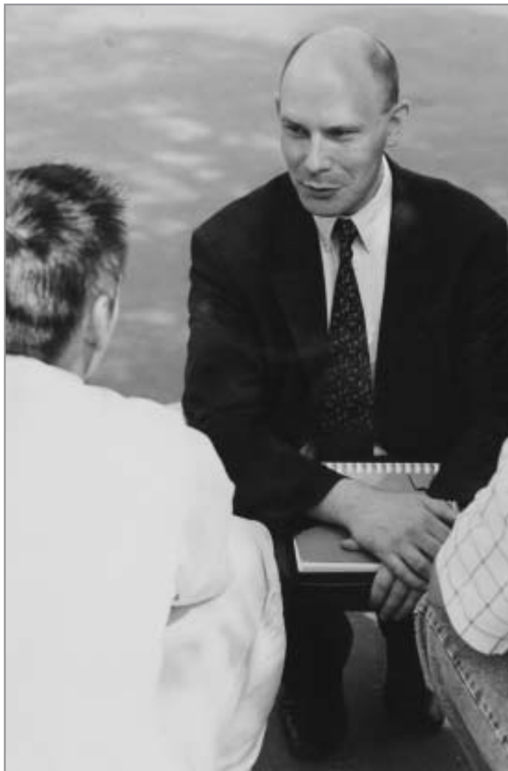
Place du Châtelet. Juin 2001