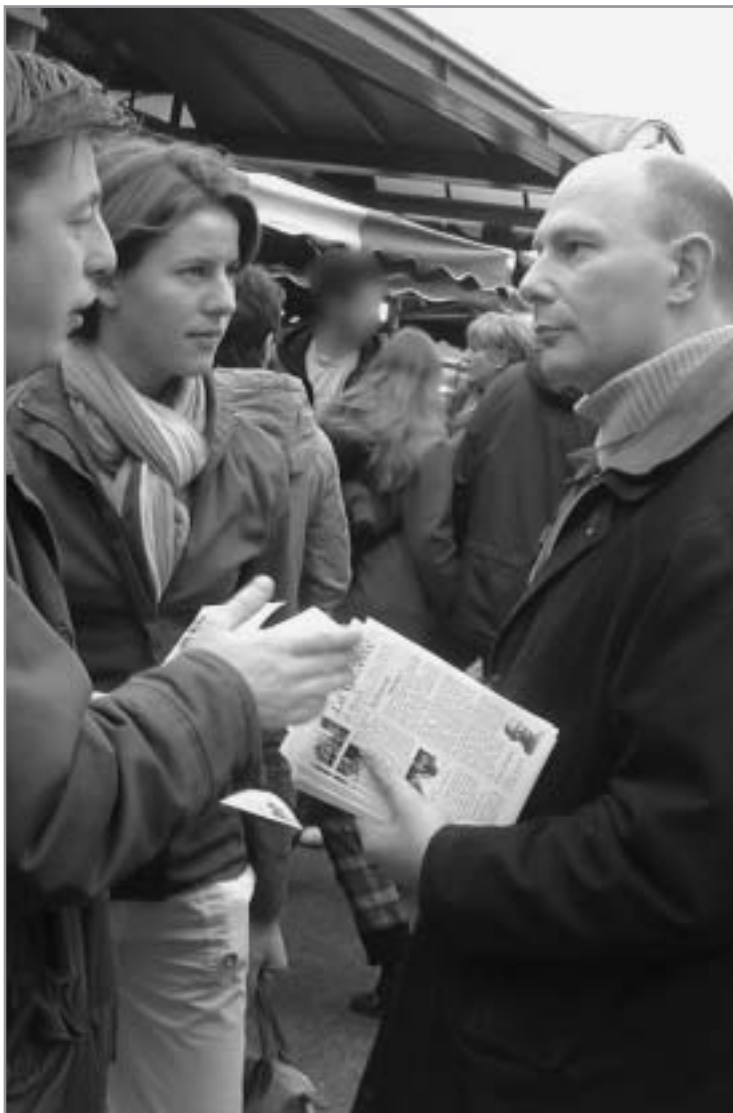
Marché place Saint-Marc. Février 2006