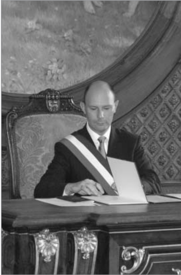
Mariage en mairie de Rouen. Juin 2005