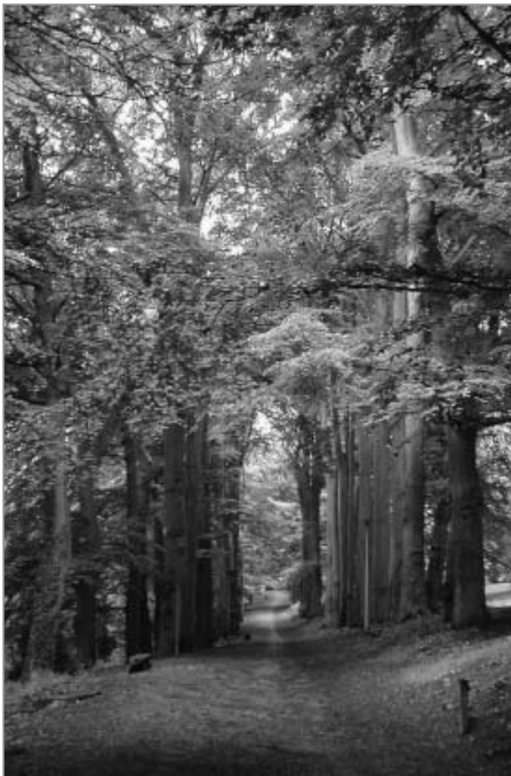
La Grand Mare "La Hêtraie". Avril 2003