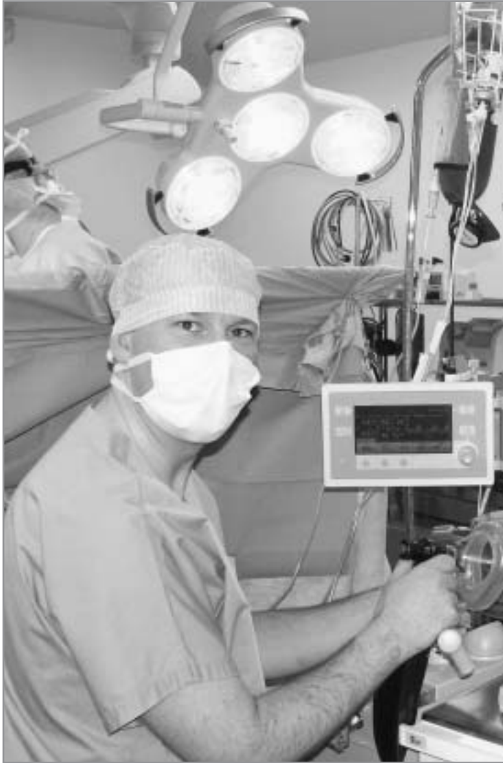
Bloc opératoire de Chirurgie cardiaque . Janvier 2006