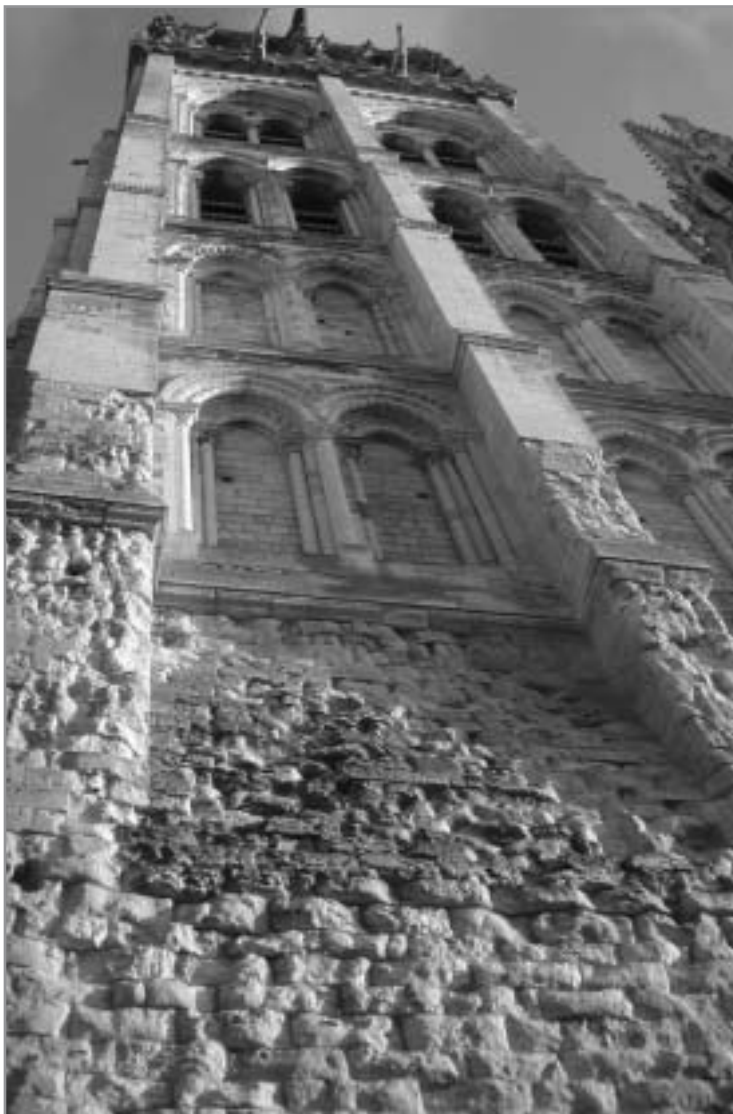
Cathédrale de Rouen, tour Saint Romain. Janvier 2006