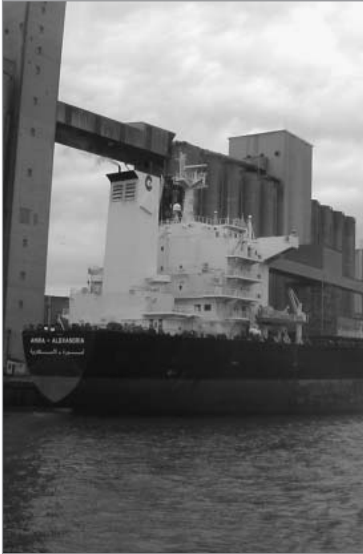
Port de Rouen. Juillet 2003