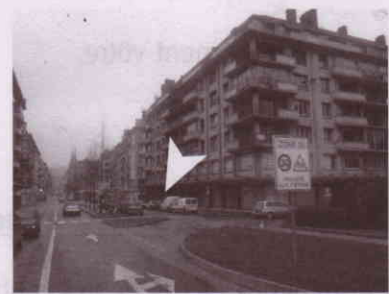
8 de la rue de la République

Nous fêterons ensemble cet évènement. Nous organiserons une opération « porte ouverte » à tous les Rouennais le vendredi 23 mars de 18h à 19h30. Nous nous retrouverons autour d'un apéritif. Je vous présenterai l'équipe qui m'entoure. C'est avec moi qu'elle vous accueillera.